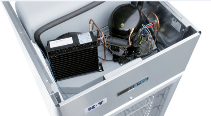
Kälteaggregat als Monoblocksystem mit verdampferfreiem Innenraum